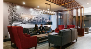
Elk+ Avenue Hotel